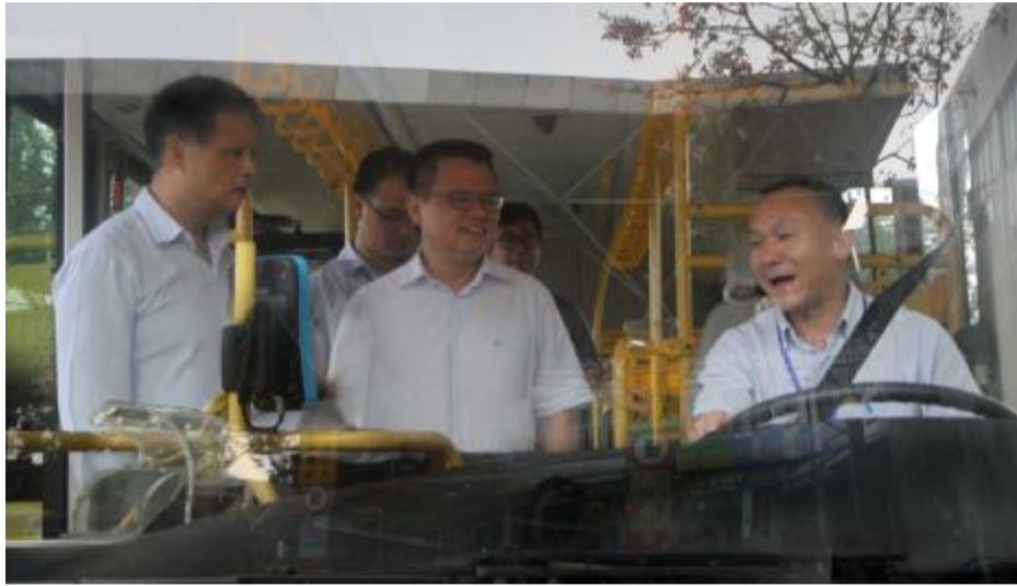
袁永康走上公交车与司机交流,阮少华陪同。

本报讯(陈晓华)“公交驾驶员手中握着的不仅是方向盘,更是一车乘客的安全。”9月27日下午,副市长袁永康带队到公交集团开展节前安全生产检查,现场检查了城南汽车客运站和公交枢纽站的安全保障工作,确保为市民提供更加安全、通畅、舒适的出行服务。