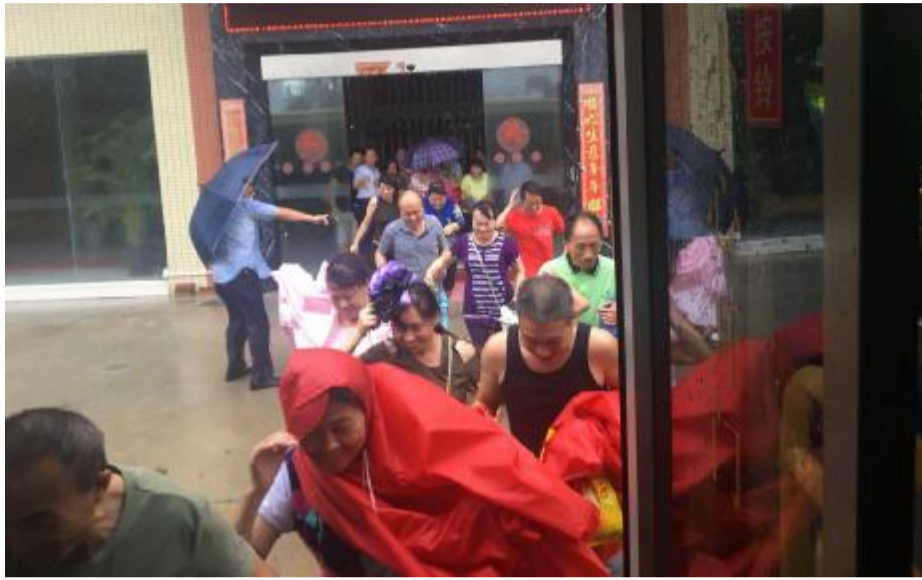
本报讯（陈晓华 林斌权）“山竹”来袭，全市进入紧急防台风、暴雨状态。公交集团党委发出战前紧急动员，启动防台 I 级预案，各级党组织委员保持手机 24 小时