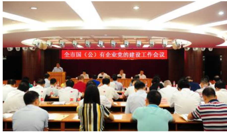
全市国(公)有企业党的建设工作会议

陈旭东强调,要深入学习贯彻习近平总书记系列重要讲话和对广东工作重要批示精神,贯彻落实全国、全省国有企业党的建设工作会议精神,切实增强思想自觉、政治自觉和行动自觉,着力推动我市国有企业党的建设再上新台阶。要坚持党对国有企业的领导不动摇,坚持服务生产经营不偏离,坚持党组织对国有企业选人用人的把关作用不能变,坚持加强国有企业基层党组织不放松,大力推进管理创新和技术创新,充分激发国有企业的创新发展能力,为国有企业改革发展、做强做优做大提供坚强有力的思想政治和组织保证。要抓住关键环节,在深化国有企业改革中全面加强党建工作。国(公)有企业党组织要把党的建设作为主业扛起来,落实从严治党主体责任。要理顺工作机制和管理体制,切实解决多个管理主体交叉、多种管理模式并行的问题。要牢牢抓住党建工作基础,抓好工作保障,严格考核问责,认真抓好我市国有企业党的建设重点任务90条措施的落地见效。