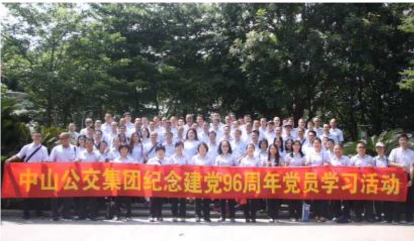
自强不息,人生才会精彩。此次活动中,集团升“两学一做”学习教育成果及加强党性修养的一项重要内容,进一步增强了全体党员、发展对象、入党积极分子的党性观念,坚定理想信念。同时强化了“公交人”自

军抗日作战,是华南抗日战场一支重要的武装力量。参观期间,党员们一边听着讲解员娓娓道来的革命故事,一边观看展厅陈列的东江纵队历史照片、文物和史料,党员们深受触动,走进了革命先烈们无私奉献、浴血奋战、夺取胜利的那一段光辉历史,增强了爱国主义情怀。 下午,党员们来到虎门海战博物馆参观学习。海战博物馆以鸦片战争古战场——虎门炮台旧址为依托,利用文物史料,展示了当年中国人民抗击英国等列强侵略者史实,生动形象地再现了鸦片战争时期中英虎门海战的悲壮场面。在参观现场,通过一张张照片、一件件文物,党员们对英国输入鸦片毒害中国,侵略中国的卑劣行径感到愤怒,同时更深入了解到落后就要挨打的事实,虎门海战将士们的英勇作战,为国捐躯的事迹更是让党员敬佩。参观完后,党员们纷纷表示不忘国耻,铭记这段落后挨打的历史,只有